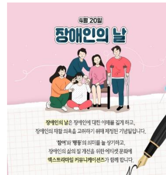
[장애인의 날 기념캠페인(21년4월)]