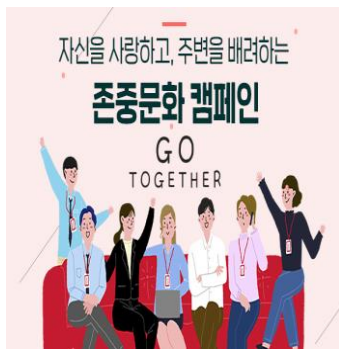
[존중 문화 캠페인(20년8월)]