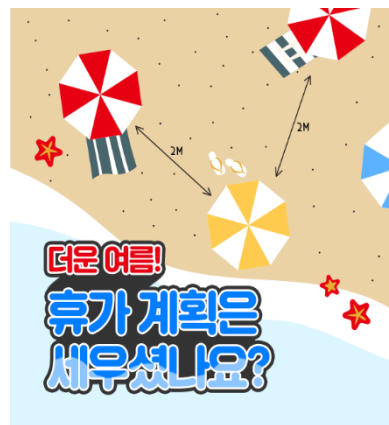
[여름철 안전 캠페인(20년7월)]