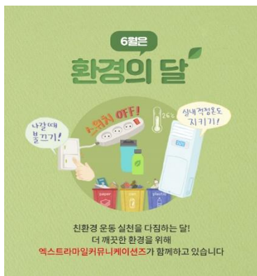
[환경의 달 캠페인(20년6월)]