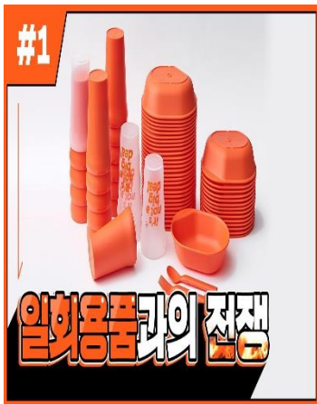
[EMC웹진 1호] 트래쉬버스터즈