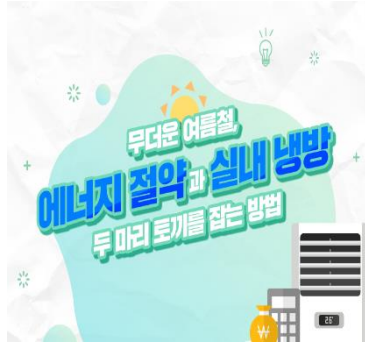
[여름 에너지 절약 캠페인(20년7월)]