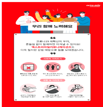
[코로나 예방 캠페인(20년7월)]