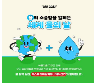
[세계 물의 날 캠페인(21년3월)]