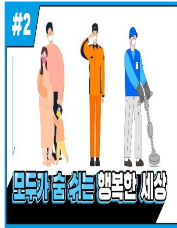
[EMC웹진 2호] 오투엠